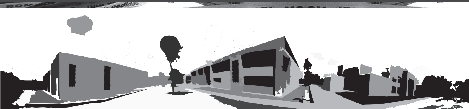
Campus Reitor Edgard Santos - Barreiras - Bahia - Brasil