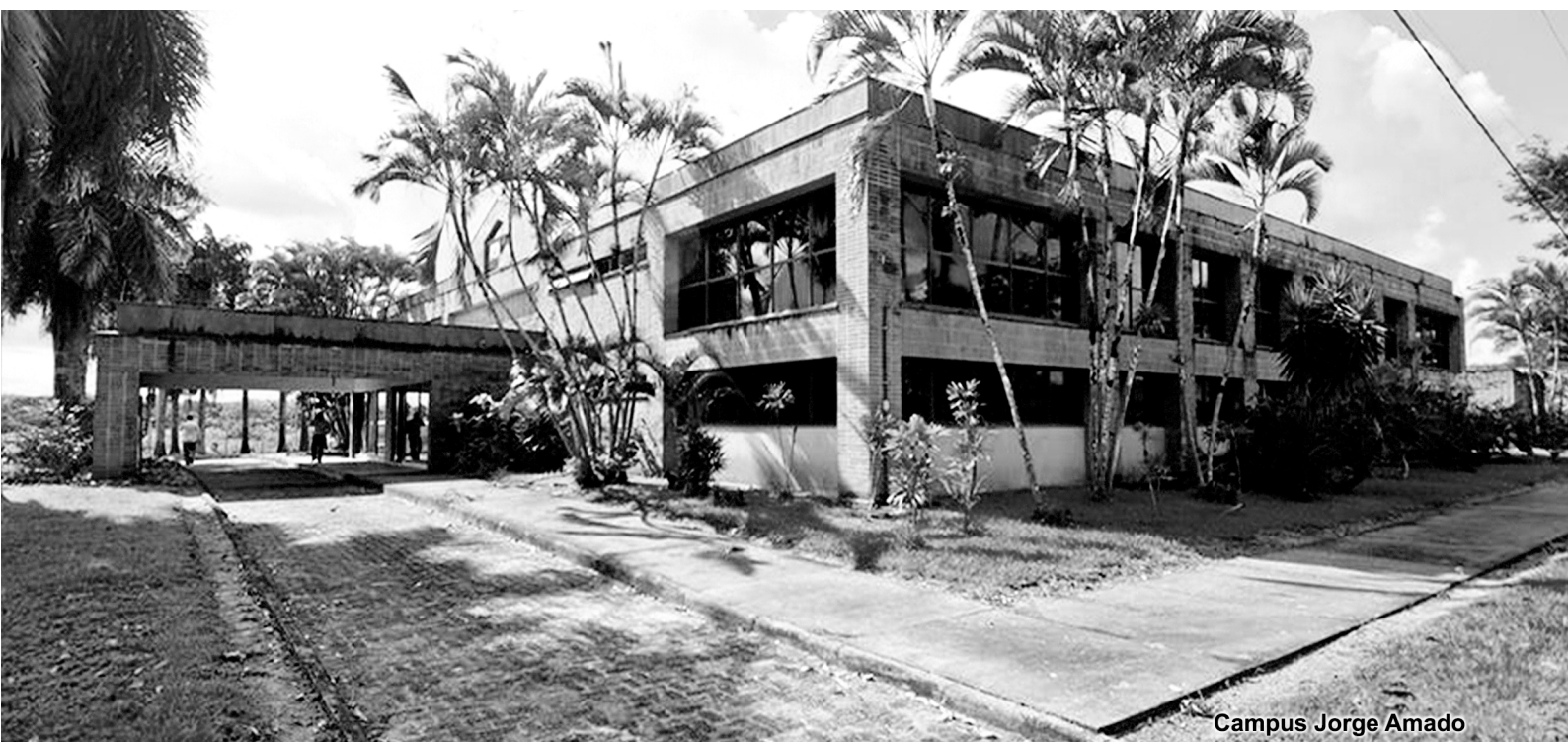
Campus Jorge Amado

19 | TÉCNICO DE TECNOLOGIA DA INFORMAÇÃO